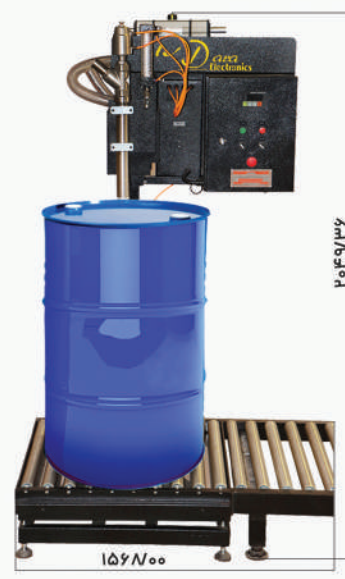
دستگاه پرکن مایع بشکه DF300/DF300M