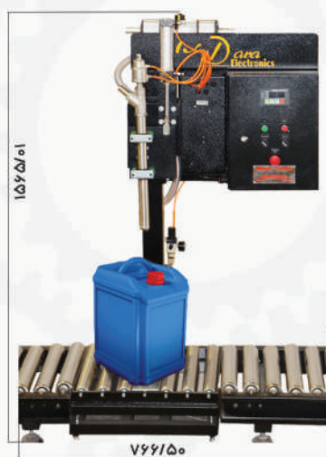
دستگاه پرکن مایع گالن DF50